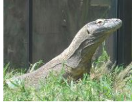
อินโดนีเซีย มังกรโคโมโด