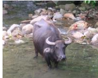
ฟิลิปปินส์ กระบือ