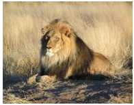
สิงคโปร์ สิงโต