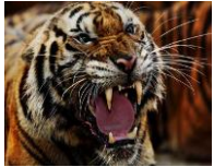
บรูไน เสือโคร่ง

สัตว์ประจำชาติของประเทศอาเซียน ๑๐ ประเทศ