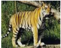
พม่า เสือ