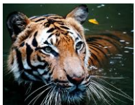
มาเลเซีย เสือมลายู