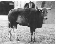
กัมพูชา กูปรี หรือ โคไพร