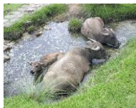
เวียดนาม กระบือ

โดย ASTV ผู้จัดการออนไลน์ วันที่ 8 กันยายน 2556 15:04 น.