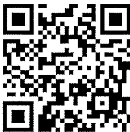
(แบบประเมินหลัง)

๑๐. ขอให้ผู้เข้าสอบทุกคน ทำแบบสอบถามเพื่อประเมินผลการป้องกันการแพร่ระบาดของโรคติดเชื้อไวรัสโคโรนา 2019 (COVID-19) ภายหลังจากเข้ารับการประเมินสมรรถนะ ไปแล้ว โดยให้สแกน QR Code หรือเข้าไปที่ https://forms.gle/PBktpokkrjLekAn6 โดยสามารถตอบแบบสอบถามได้ตั้งแต่วันที่ ๑๒ - ๑๖ กันยายน ๒๕๖๔ เพื่อการติดตามผลและป้องกันการแพร่ระบาดของโรคติดเชื้อไวรัสโคโรนา 2019 (COVID-19)